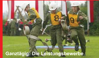
Ganztägig: Die Leistungsbewerbe