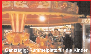
Ganztägig: Rummelplatz für die Kinder